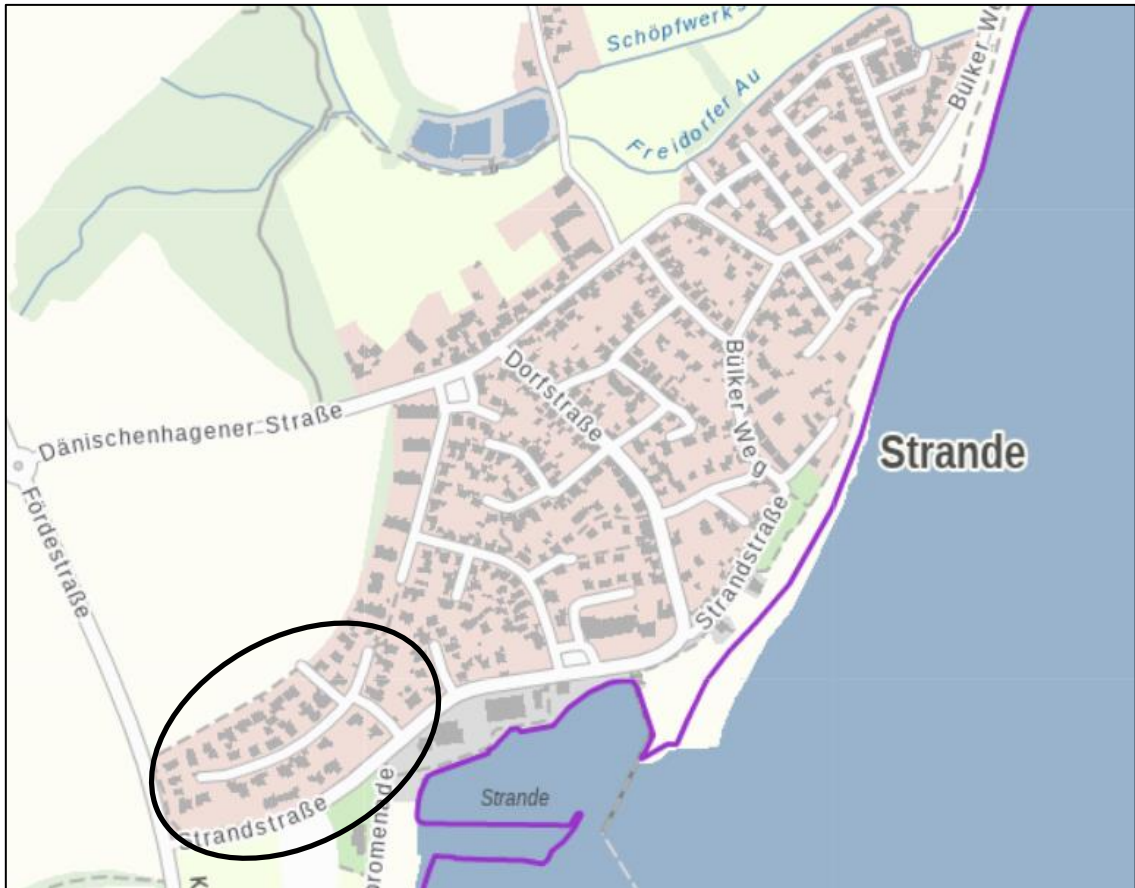
Lage des Plangeltungsbereiches innerhalb des Gemeindegebietes

Der Geltungsbereich der 2. Änderung des Bebauungsplanes Nr. 7 befindet sich im westlichen Bereich des Gemeindegebietes und umfasst den nördlichen, durch Wohnbebauung geprägten Bereich des relativ großen Geltungsbereiches des B-Planes Nr. 2 als Ursprungsplanung.