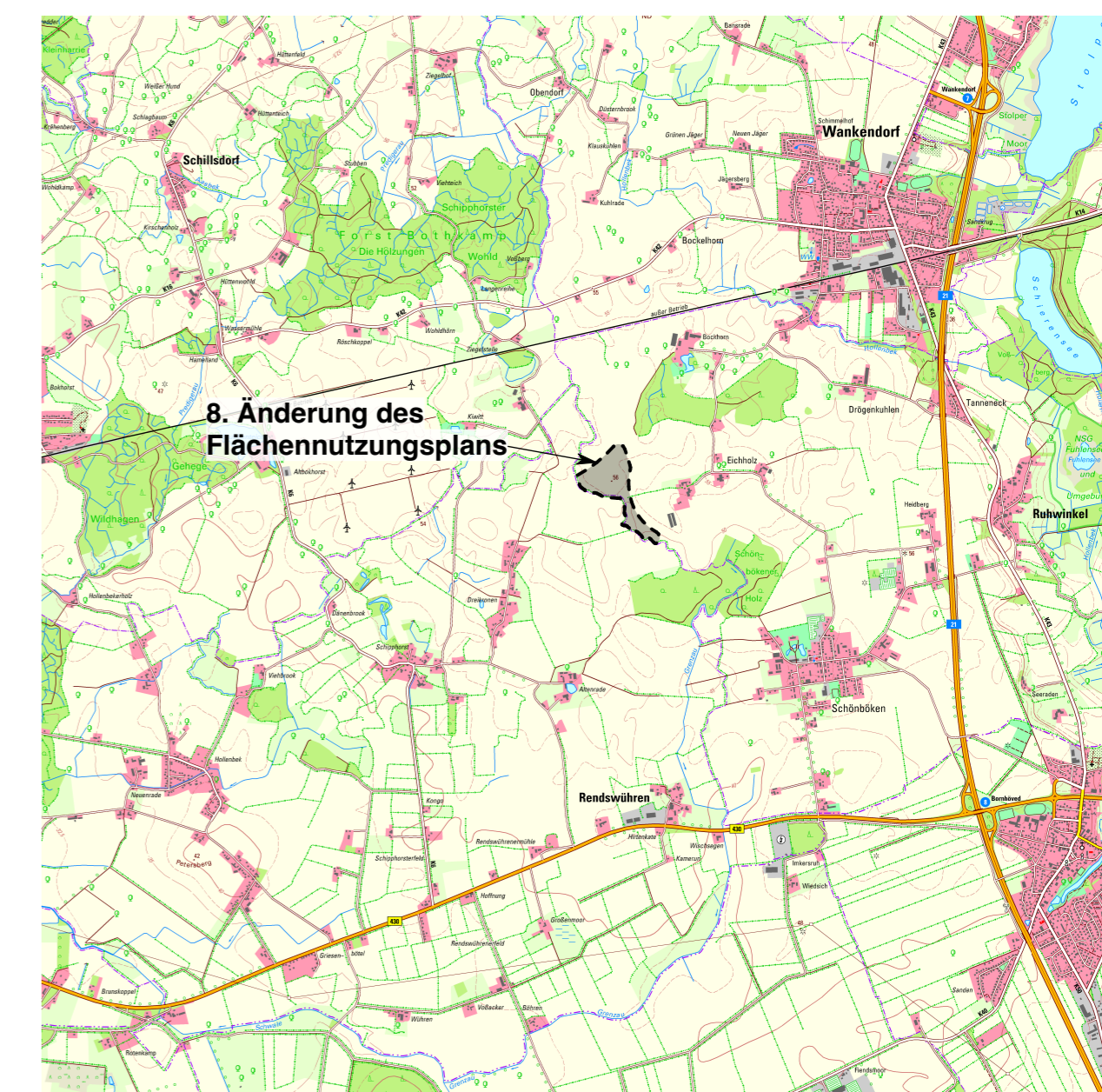
Übersichtsplan Maßstab 1: 50.000