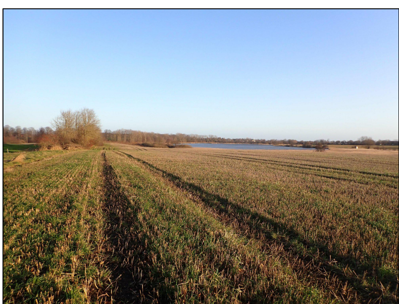
Östliche Ausgleichsteilfläche, Blickrichtung Nordost; im Hintergrund der Fuhlensee