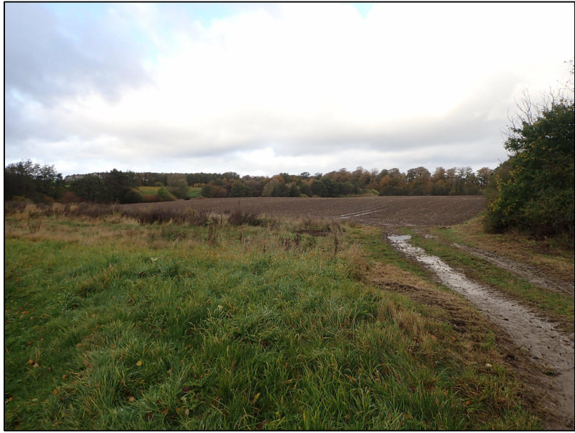
Westliche Ausgleichsteilfläche, Blickrichtung Nordwest; rechts die Trasse der Schmutzwasserleitung