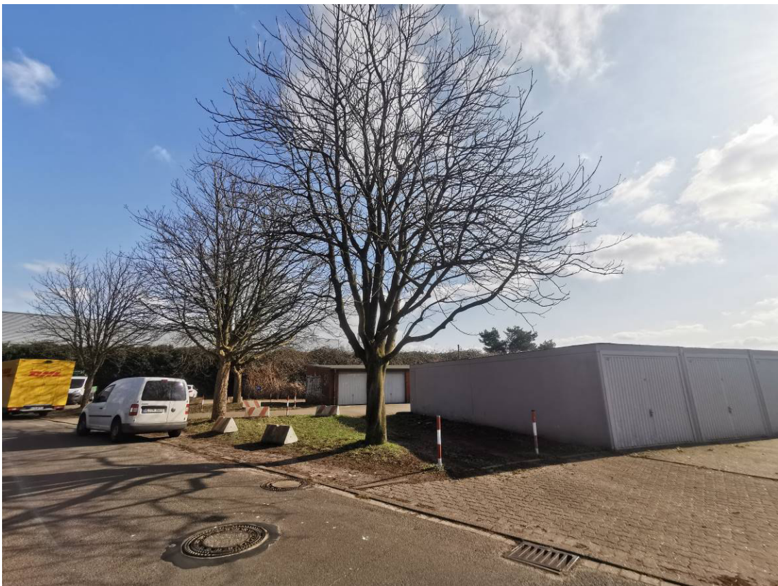
Kastanien Nr. 1 – 4 an der nördlichen Grundstücksgrenze