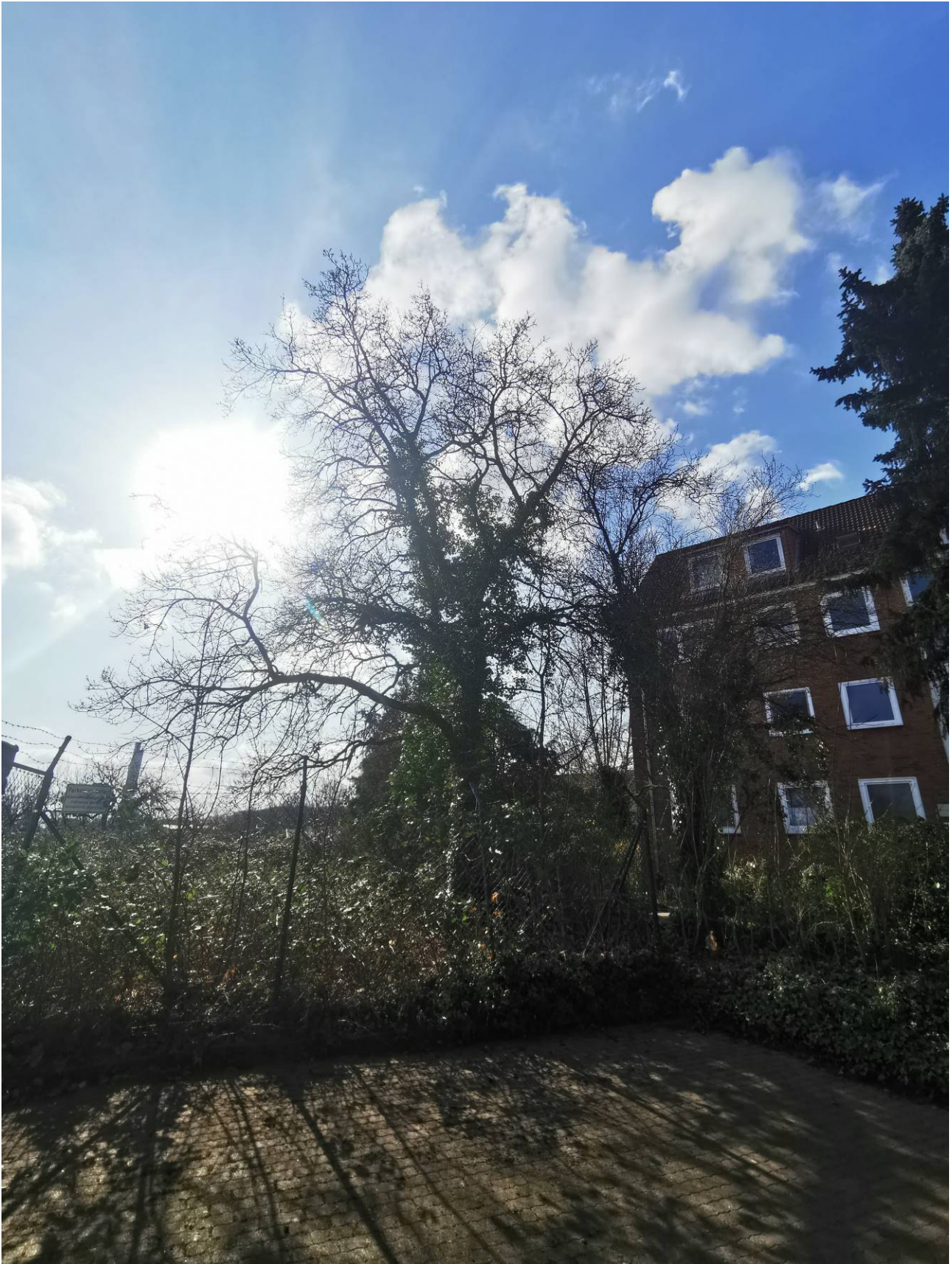
Stieleiche Nr. 9 im rückwärtigen Grundstücksteil