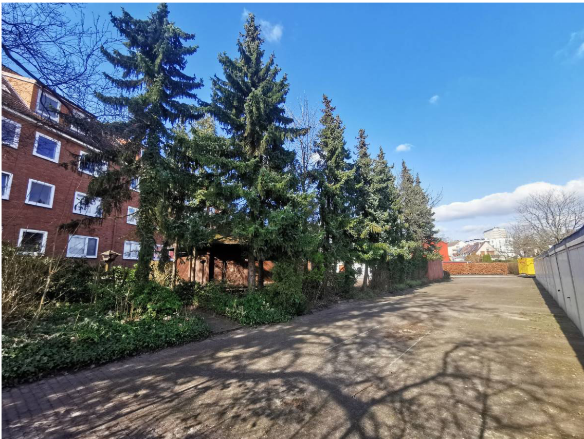
Fichtenreihe entlang der westl. Grundstücksgrenze