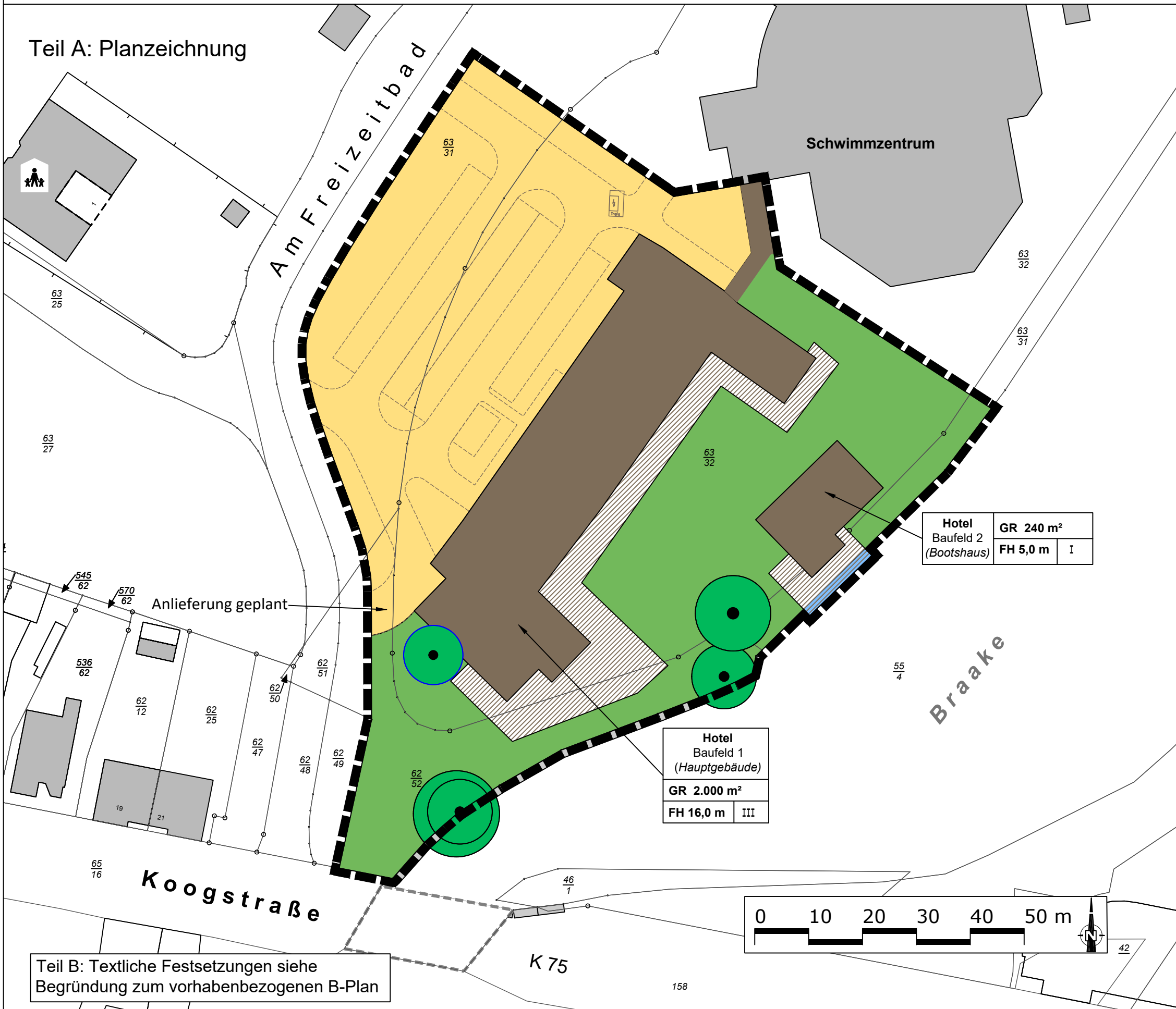
Teil A: Planzeichnung

Teil B: Textliche Festsetzungen siehe Begründung zum vorhabenbezogenen B-Plan