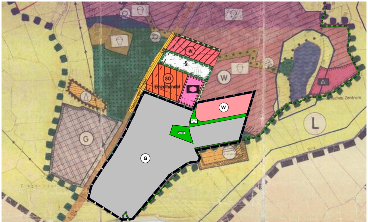
Abbildung 2: Zukünftige Darstellung der 50. Änderung, eingefügt in den wirksamen Flächennutzungsplan (ohne Maßstab)