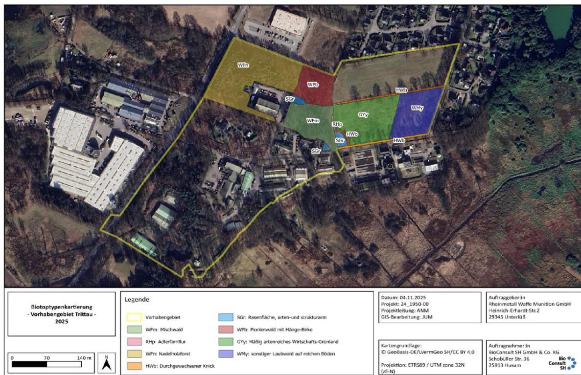
Abbildung 3: Übersicht planerischer Rahmenbedingungen

Die folgende Abbildung stellt den bereits kartierten Anteil des Geltungsbereiches und die erfassten Biotoptypen dar.