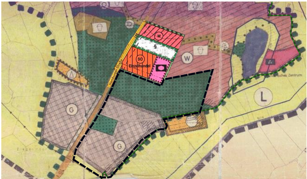
Abbildung 1: Bisherige Darstellung des wirksamen Flächennutzungsplanes (1976) sowie der angrenzenden 39. Änderung (2020) mit Geltungsbereich der 50. Änderung (schwarz markiert, ohne Maßstab)

Im südlichen Bereich ist ein Teil als landwirtschaftliche Fläche dargestellt. Hierbei wird von einer nicht parzellenscharfen Darstellung des Flächennutzungsplanes von 1974 ausgegangen, da der Geltungsbereich im Süden ausschließlich das Grundstück der Firma Rheinmetall umfasst.